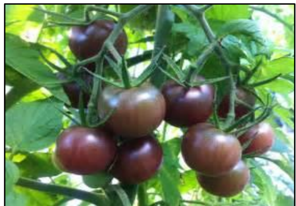
Tomate cerise noire