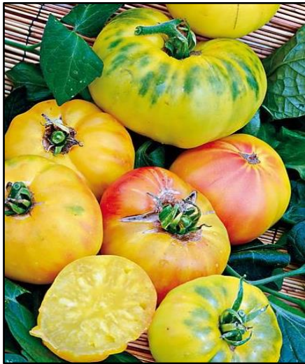
Tomate Lillian's Yellow Heirloom