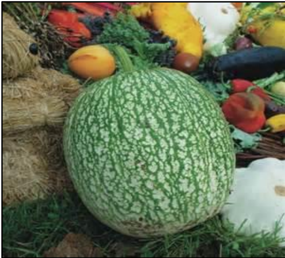
Courge de Siam, Ficifolia, ressemble à une pastèque, utilisée pour faire une confiture en Espagne et au Portugal avec de la vanille et de la cannelle