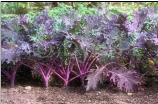
Chou Kale Red Russian