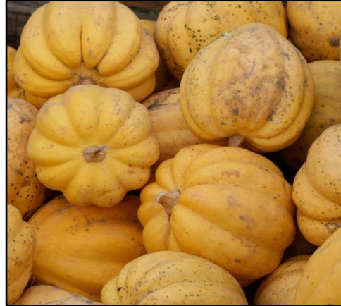
Cour Table Gold