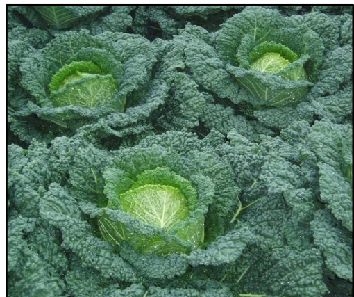
Chou de Milan Marnier Grufewi