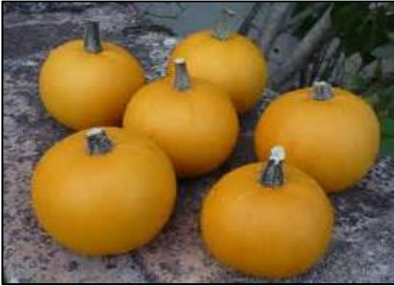
Courge Pepo Pomme d'or