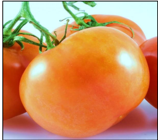
Tomate Flammée jaune