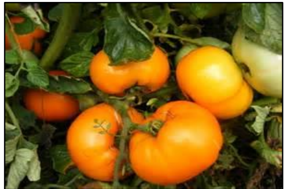
Tomate Golden Queen